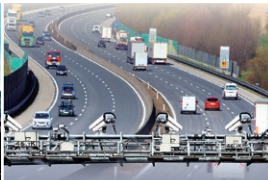
ITS (高度道路交通システム)