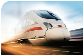
交通安全システム